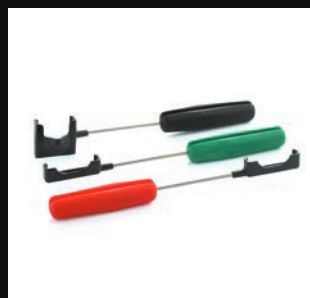
Holder di tipo "toothbrush"

* include una garanzia di 1 anno e 4 anni di protezione Care-Protect.